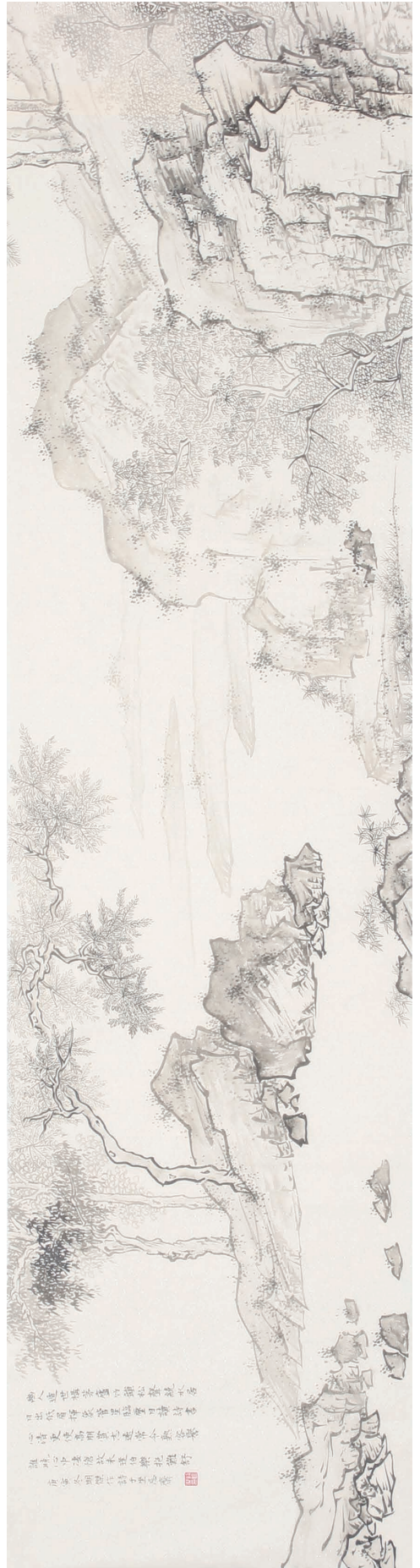
刘明杰作品 山水（整幅两段）